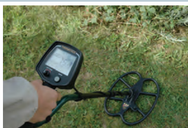
Vous pouvez adapter des disques SEF 30 ou 38 cm sur votre Teknetics T2 !

stock. Elle est la seule habilitée à effectuer un SAV direct auprès du fabricant ce qui évite tout problème et long délai en cas de panne.