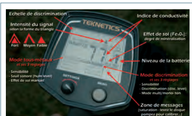
Le T2 est très simple à utiliser tout en proposant tous les réglages d'un haut de gamme !