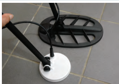
Le disque 27 cm DD d'origine et le DD 12 cm.