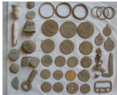
Voici quelques trouvailles de Spirou13, qui en moins d'un an, a trouvé quatre fois "du jaune" avec son T2 et ses 14kHz!

Voici quelques unes des belles trouvailles exhumées à l'aide d'un T2 aux États Unis et au Royaume Unis. Monnaies médiévales, bagues antiques, fibules, artefacts de la guerre de Sécession, compas ancien, dépôt de métaux, rare nummus de Constantin...elles sont diverses mais plus belles les unes que les autres.